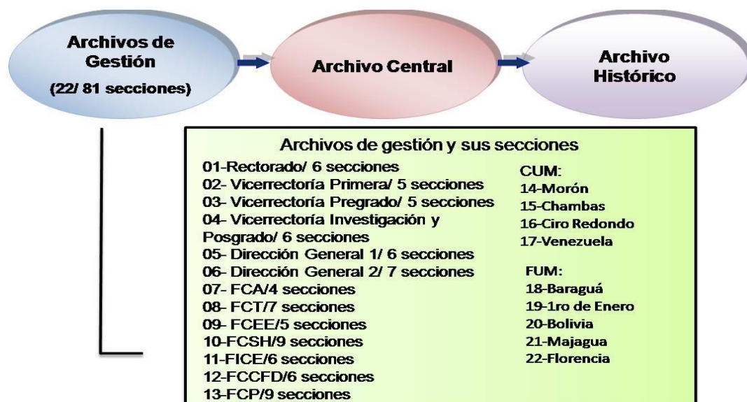
Estructura del SIGDA en la UNICA