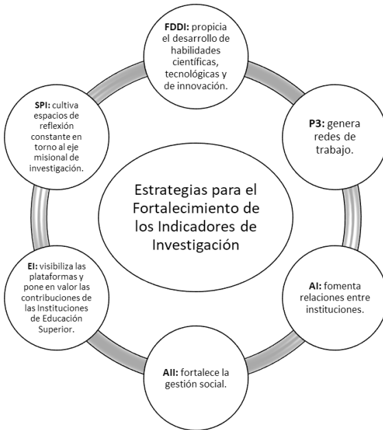
Estrategias para el Fortalecimiento de los Indicadores de Investigación