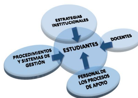
Figura 1. Enfoque centrado en el estudiante