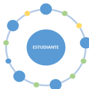
Figura 4. Ciclo del servicio

Paso 3. Identificación de los momentos negativos de la verdad.