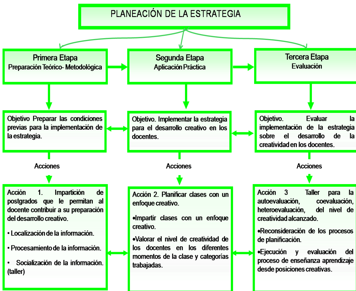
Esquema 2: Planeación de la estrategia. 1