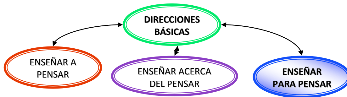
Figura 1: Propuesta de direcciones para el fomento del desarrollo creativo.

Se retoma la propuesta de direcciones para el fomento del desarrollo creativo trabajado por Margarita Silvestre (2002) y se asume la tercera «enseñar para pensar».