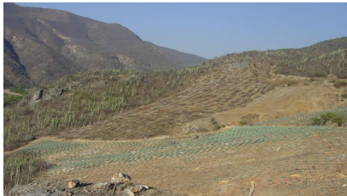
Figura 1. Deforestación del ecosistema de selva seca caducifolia para abrir terrenos al cultivo de agave angustifolia Haw, de mayor uso en agroindustria del mezcal.

Por otro lado, se están extinguiendo los ecosistemas de selva baja o selva seca caducifolia para disponer de terrenos para siembra de agaves cultivados como Angustifolia Haw (Espadín), que es el de mayor demanda en la cadena productiva Agave- Mezcal. (Fig. 1)