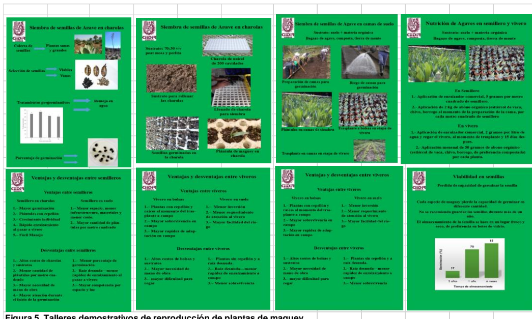
Se Figura 5. Talleres demostrativos de reproducción de plantas de maguey

impartieron en campo cinco talleres demostrativos con la participación de productores de los cuatro pueblos mancomunados, se tienen actualmente en viveros aproximadamente 1.6 millones de plantas de magueyes silvestres y cultivados un promedio de 400 mil por municipio, las mismas que permanecerán en vivero aproximadamente un año medio para poder ser trasplantadas en parcelas de cultivo y otras sembradas en su hábitat natural.