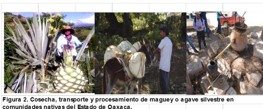
Figura 2. Cosecha, transporte y procesamiento de maguey o agave silvestre en comunidades nativas del Estado de Oaxaca.

La Figura 2, muestra un ejemplo de la forma en que los magueyes o agaves silvestres son extraídos de su medio natural para la elaboración de mezcal de tipo ancestral o artesanal, y se sabe por comunicación oral con los productores que cada día se tienen que hacer recorridos más largos por las montañas, entre cuatro y cinco horas, para conseguir piñas en edad de cosecha, entre seis y ocho años de edad, utilizando animales de carga para su transporte.