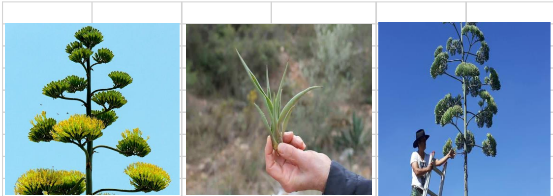
Figura 4. Diferentes formas de reproducir plantas de maguey silvestres y cultivado