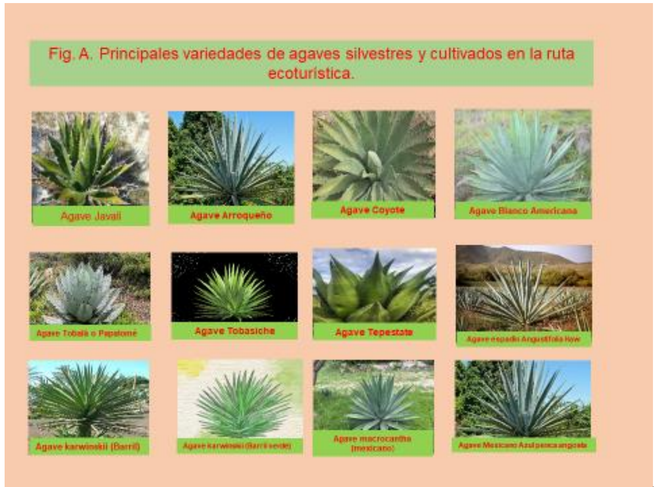
Figura A: Principales variedades de agaves silvestres y cultivados en la ruta ecoturísticas.

Esta ruta se ubica en tres regiones del Estado de Oaxaca; Mixteca Alta, Valles Centrales y Sierra Sur, comienza en la Ciudad de Oaxaca, ubicada en los Valles Centrales del Estado y desde allí se puede desplazar hacia el norte por la autopista que conduce a la Ciudad de México, hasta llegar a la Ciudad de Asunción Nochixtlán, para continuar en dirección al municipio de Magdalena Jaltepec y siguiendo la ruta marcada con rojo en el Mapa 1, se termina la ruta de los mezcales proveniente de agaves silvestre en la Comunidad del Vado, un poco antes de llegar a este punto se recomienda al visitante, tomar una desviación de un trayecto muy corto para visitar la comunidad de Villa Sola de Vaga y San Miguel Sola de Vega, que es el santuario de del mezcal “tobalá”, en donde se localizan los maestros mezcaleros más experimentados en la destilación de esta bebida y de otras provenientes de agaves silvestre, se recomienda además realizar este recorrido en sentido inverso, es decir; inicia en la Ciudad de Oaxaca de Juárez tomando la dirección sur rumbo a Villa de Zaachila, continuando por el distrito de Zimatlán de Álvarez, pasando por las comunidades de Santa Gertrudis, San Pablo Huixtepec y continuando hacia