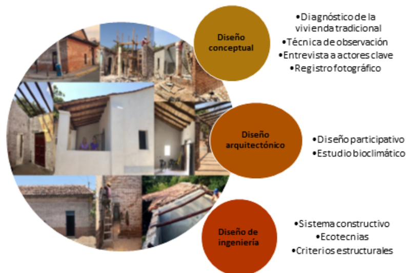
Figura 1. Metodología de diseño de la vivienda Yoo Binni Gulazaa. El proceso de diseño de la vivienda se conceptualizó bajo criterios de sustentabilidad, para ello, se emplearon dos metodologías; de Fuentes (2002) para dar solución a los aspectos bioclimáticos, y la metodología de diseño participativo de soportes y unidades separables (Habraken, 1979) que involucró a personas de la ciudad de Juchitán de

Una de las estrategias principales que se establecieron en el plan de intervención fue el diseño de vivienda con arquitectura tradicional (Vivienda Yoo’ Binni Gulazaa). El proceso de diseño contempló tres etapas: diseño conceptual, diseño arquitectónico y diseño de la ingeniería (Figura 1).