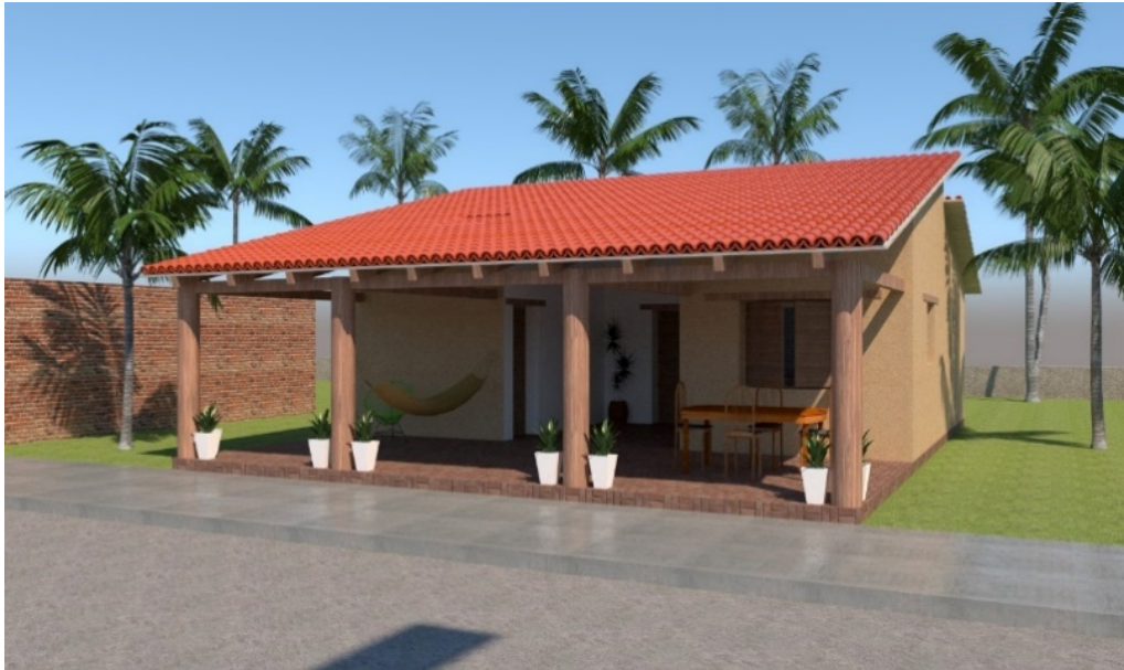
Figura 3. Perspectiva de la vivienda “Yoo Binni Gulaaza” área de corredor.

La vivienda diseñada propone como estrategia de construcción “Guenda racané sá” que en español significa ayuda mutua o también conocido como tequio, donde se invitan familiares, amigos y vecinos quienes participan durante las diferentes etapas de la construcción (Figura 3).