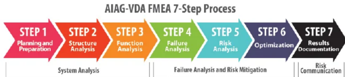
Figura 1. Pasos para aplicación de la Metodología AMEF.

El AIAG es una organización a escala mundial que sirve de foro abierto para que empresas de todo el mundo desarrollen y compartan información que contribuya con la industria automotriz. En el año 2019 publicó el nuevo formato VDA AIAG. Este formato admite un enfoque de 7 pasos para desarrollar la metodología AMFE, que adecuado a la actividad constructiva se desarrollaría: Ver Figura 1.